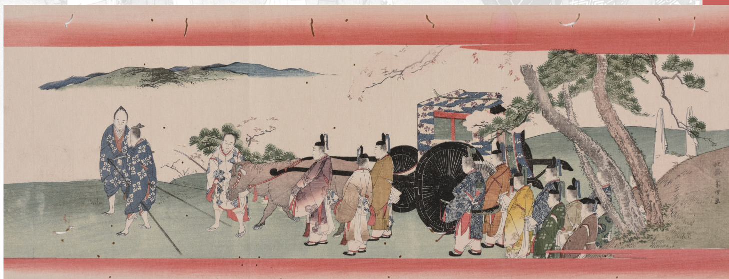
葛飾北斎《曙艸(吉野山花見)》[津和野藩伝来摺物] 島根県立美術館蔵

国際ロータリー第2690地区(鳥取・島根・岡山) 2023-24年度地区ガバナー 石倉 貞昭