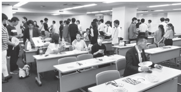
西日本7地区ローターアクト交流会