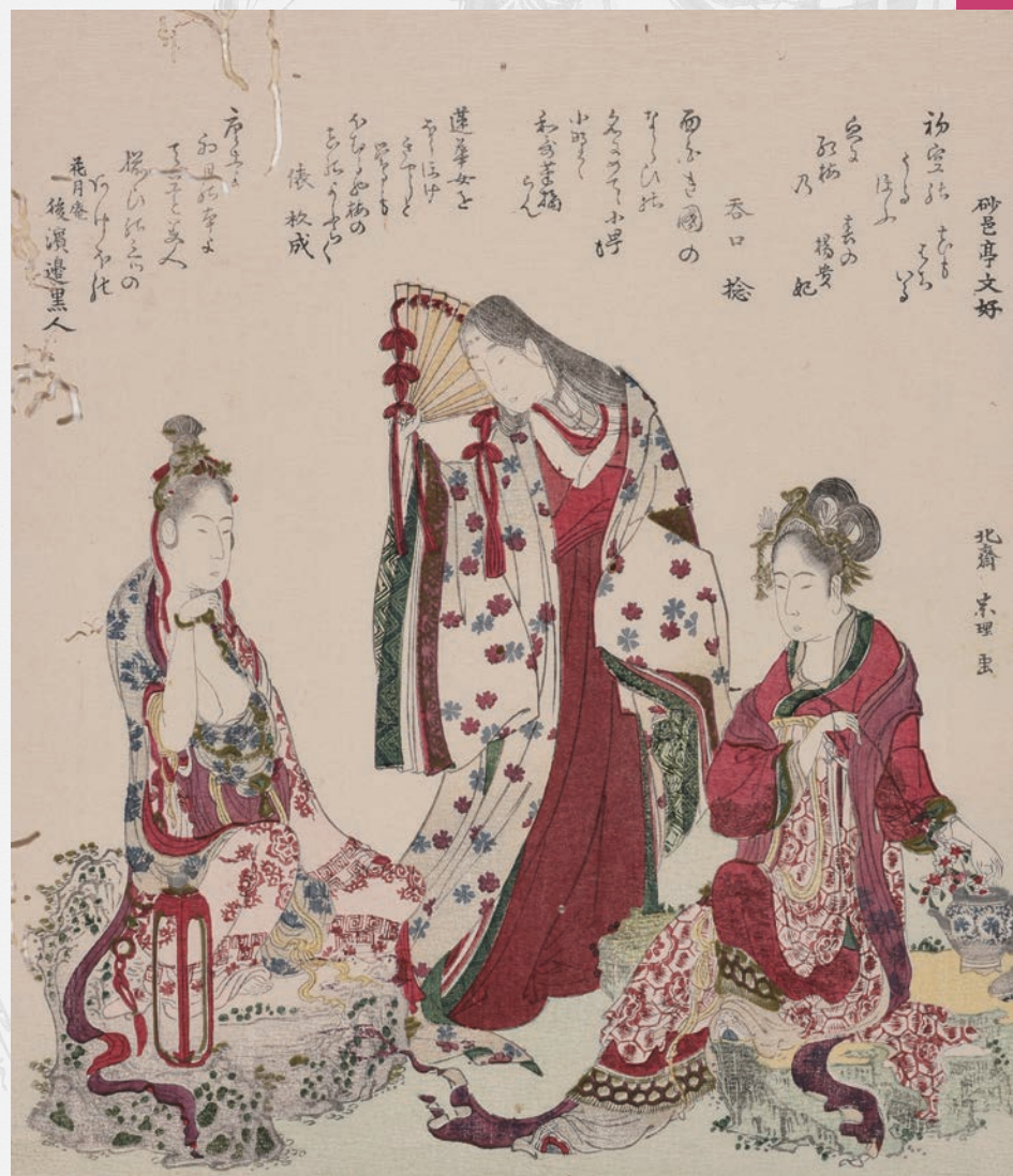
葛飾北斎「(楊貴妃 小野小町 蓮花女) [津和野藩伝来摺物]」島根県立美術館蔵

国際ロータリー第2690地区(鳥取・島根・岡山) 2023-24年度地区ガバナー 石倉 貞昭